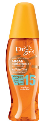
DR SUN Солнцезащитное масло аргана для тела SPF 15 с какао- маслом, 150 мл