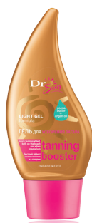
DR SUN Гель для ускорения загара для тела (на пляже и в солярии) с маслом аргана и какао-маслом, 150 мл