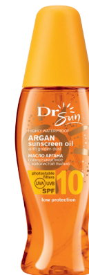
DR SUN Солнцезащитное масло аргана для тела с золотистой пылью SPF 10, 150 мл