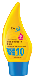
DR SUN Солнцезащитный бальзам для тела с маслом аргана и какао-маслом SPF 10, 150 мл