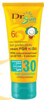
DR SUN Солнцезащитный гипоаллергенный крем для лица и тела для детей с 6 месяцев SPF 30, 75 мл