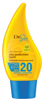
DR SUN Солнцезащитный бальзам для тела с маслом аргана и какао-маслом SPF 20, 150 мл