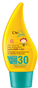
DR SUN Солнцезащитный гипоаллергенный бальзам для тела для детей с 6 месяцев SPF 30, 150 мл

Более 20 лет мы заботимся о безопасности Вашей кожи во время загара. К этому сезону мы подготовили специальную линию средств для загара и после загара Dr Sun, которая позволит Вам и Вашей семье наслаждаться солнцем, а также красивым и здоровым загаром.