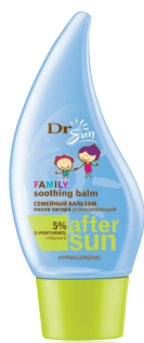
DR SUN Успокаивающий гипоаллергенный бальзам для тела после загара с 5-% Д-пантенолом для взрослых и детей с 1 месяца, 150 мл