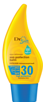
DR SUN Солнцезащитный бальзам для тела с маслом аргана и какао-маслом SPF 30, 150 мл