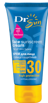
DR SUN Солнцезащитный гипоаллергенный крем для лица с маслом аргана для всех типов кожи SPF 30, 50 мл