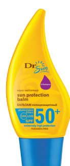
DR SUN Солнцезащитный бальзам для тела с D-пантенолом SPF 50+, 150 мл

Желаем Вам замечательного и незабываемого отдыха!