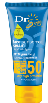
DR SUN Солнцезащитный гипоаллергенный крем для лица с маслом аргана для всех типов кожи SPF 50+, 50 мл