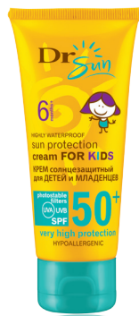
DR SUN Солнцезащитный гипоаллергенный крем для лица и тела для детей с 6 месяцев SPF 50+, 75 мл