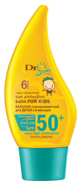
DR SUN Солнцезащитный гипоаллергенный бальзам для тела для детей с 6 месяцев SPF 50+, 150 мл